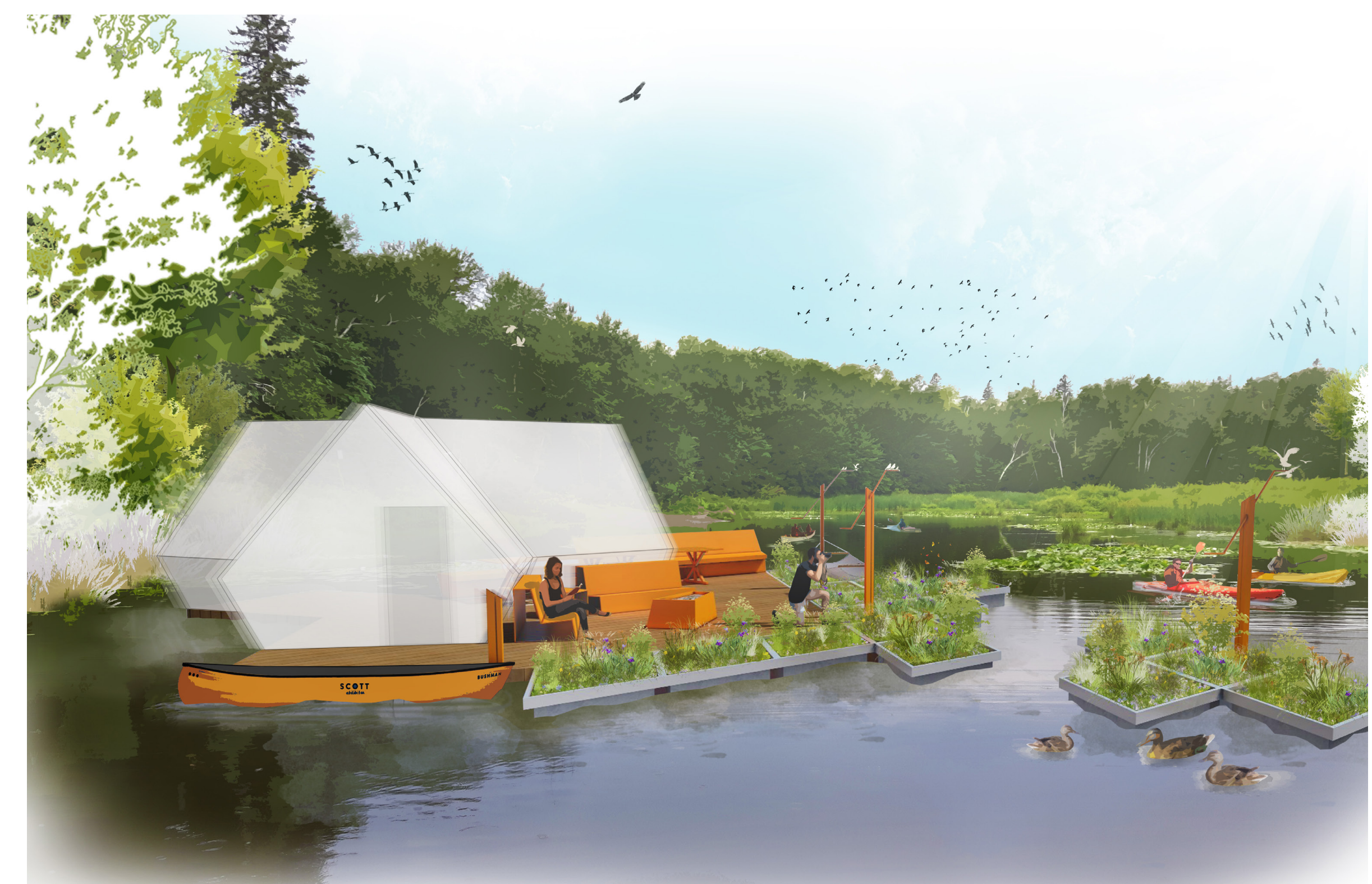
Hébergement sur l'eau